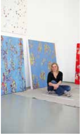
Andrea Bischof Malerei